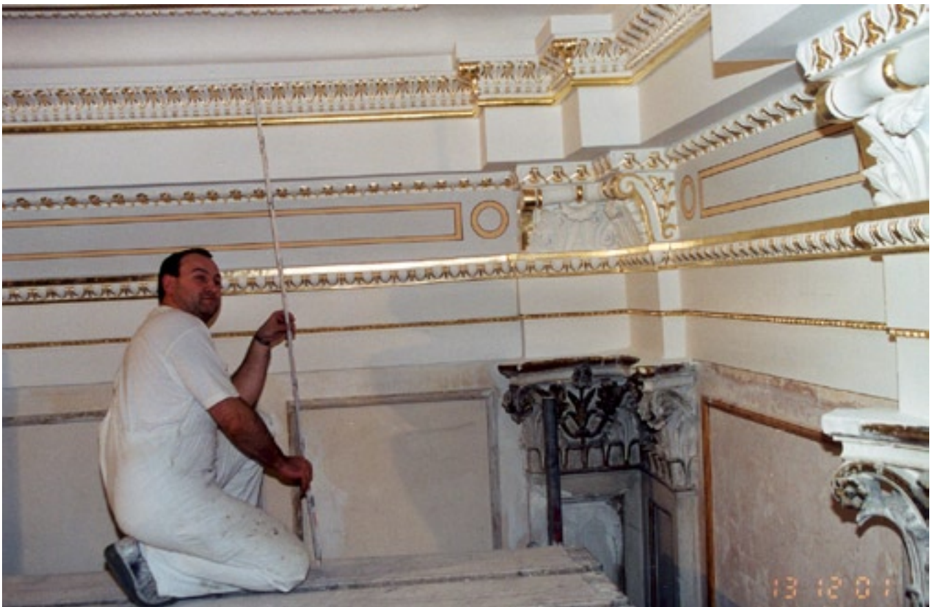
Zustand nach der Restaurierung.

Objekt: Denkmal Großer Saal Münzstraße 8 (19.Jh.) Adresse: Münzstraße 8, 19055 Schwerin Leistungen: Maler- und Vergoldungsarbeiten an der Decke Fertigstellung: Dezember 2001