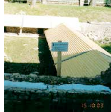
Barbarathermen in Trier

Objekt Barbarathermen Adresse 54290 Trier (Rheinland Pfalz) Leistungen Couvertierung historisches Mauerwerk Musterentwurf für Stulpschalung Entwicklung Schutzdach Ausführung 2003