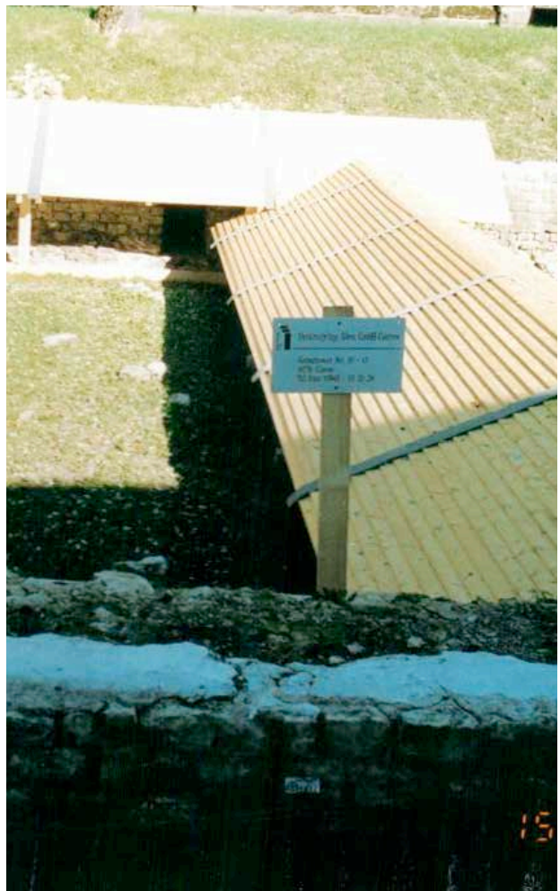
Couvertierung während des Aufbaus und nach Fertigstellung der Arbeiten im 1. Bauabschnitt