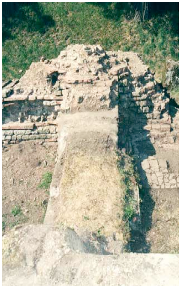
Vorzustand der historischen Anlage