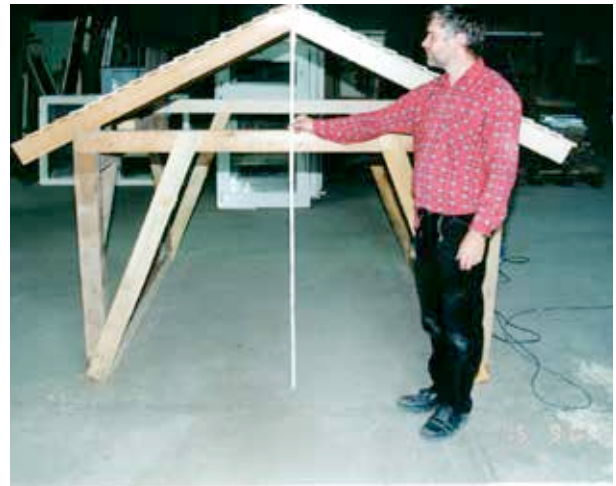
Zeichnung und Musterentwurf Schutzdach für historisches Mauerwerk