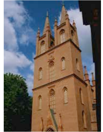
Klosterkirche Dobbertin erbaut im 13./14. Jahrhundert

Objekt Doppelturmfassade Klosterkirche Dobbertin Adresse Klosterkirche Dobbertin, 19399 Dobbertin (Mecklenburg Vorpommern) Leistungen Fassadensanierung Turmanlage / Restaurierung von Türen, Fenstern, Schallluken und Treppen Fertigstellung 2005 - 2006