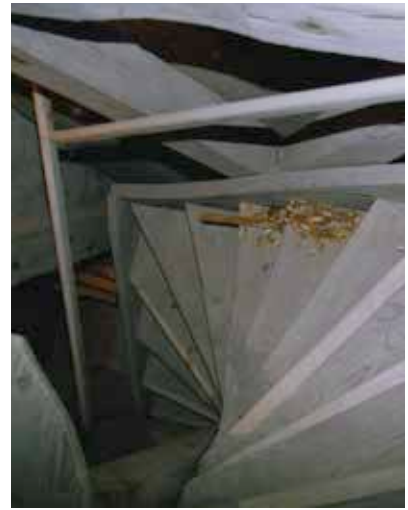
Zwischenzustand kleine Schallluke während der Restaurierung und Treppenneubau