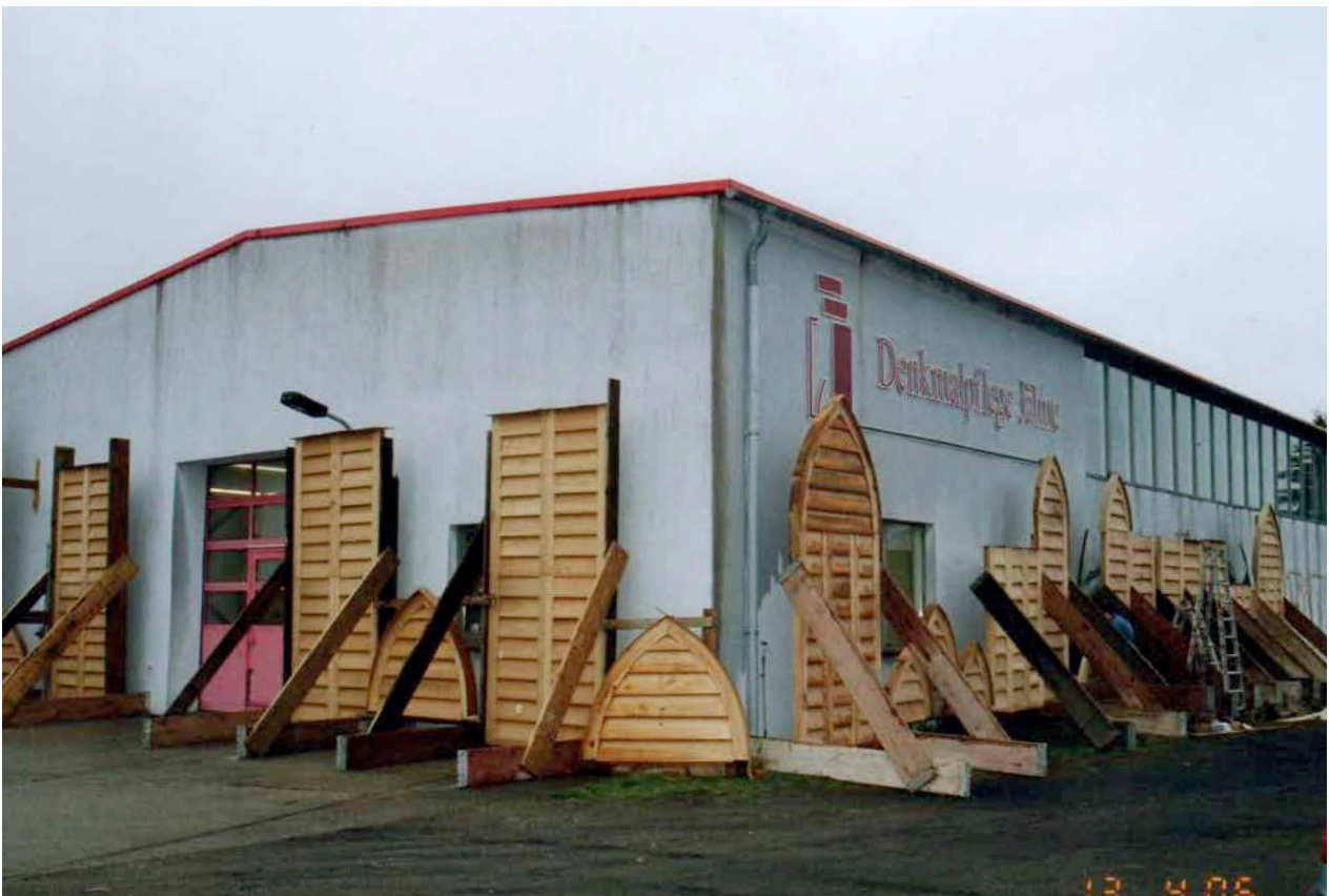
Neubau und Wässerung der Eichenholzschallluken