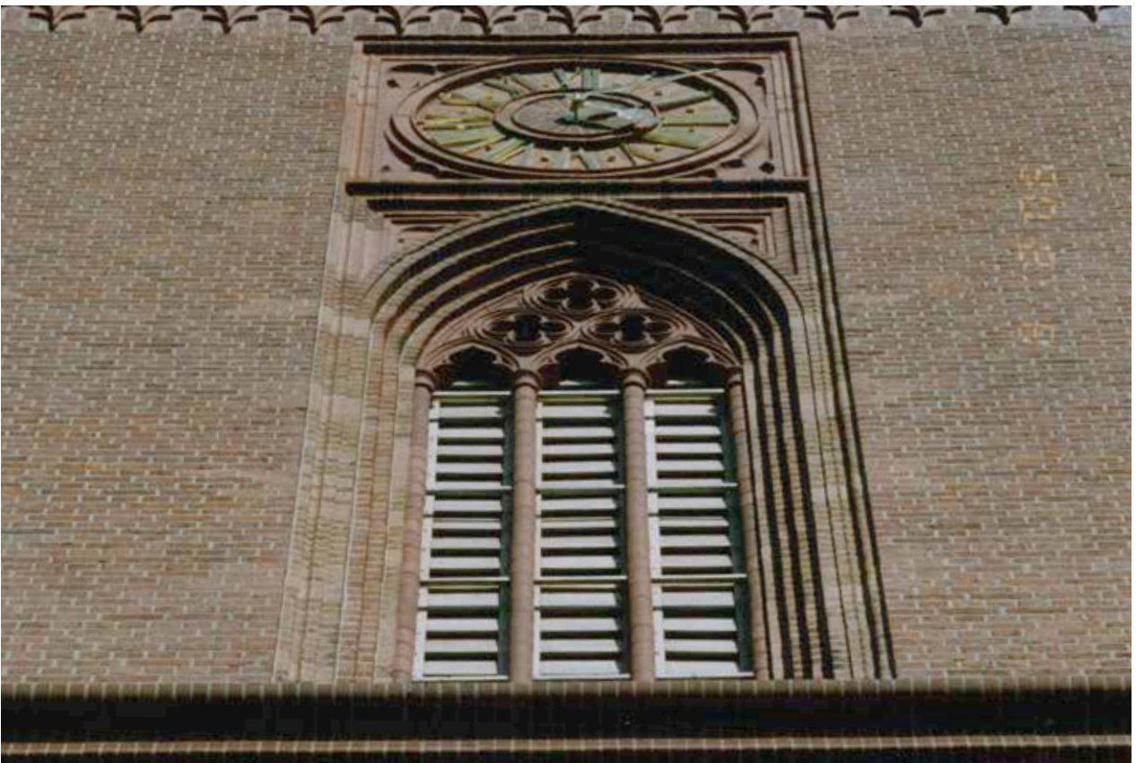
Fassade der Turmanlage nach Einbau und Sanierung der Eichenholzschallluken zur Fertigstellung der Arbeiten