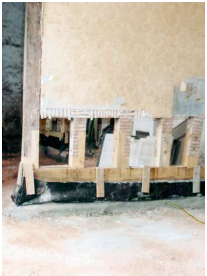
Vorzustand Fachwerkwand und Fachwerkwand mit Passstücken