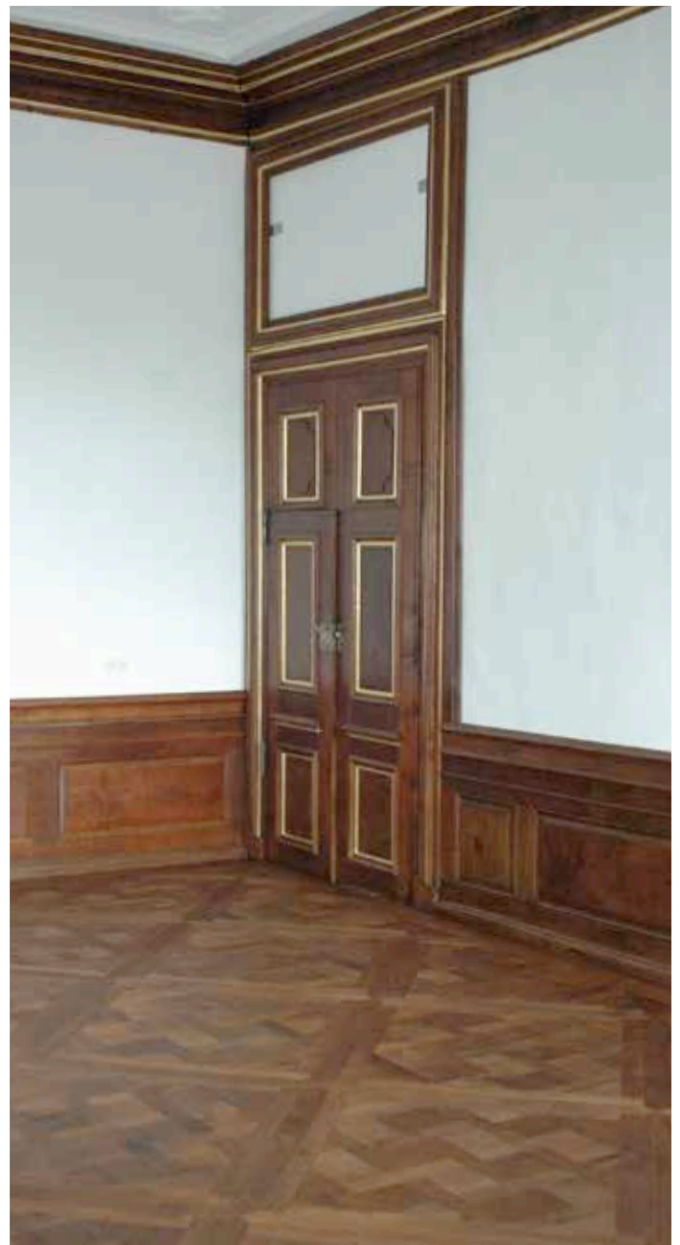
Fußboden Neues Haus während und nach den Arbeiten