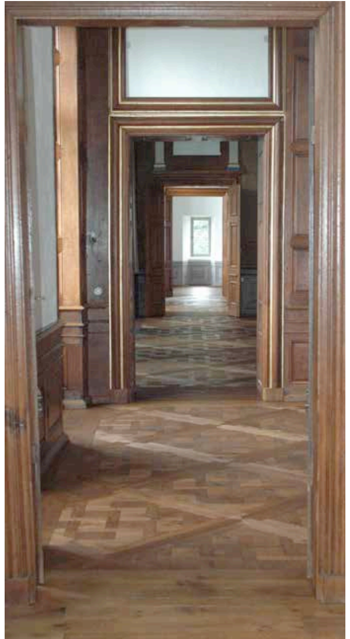
Fußboden Neues Haus nach Abschluß der Arbeiten 2009