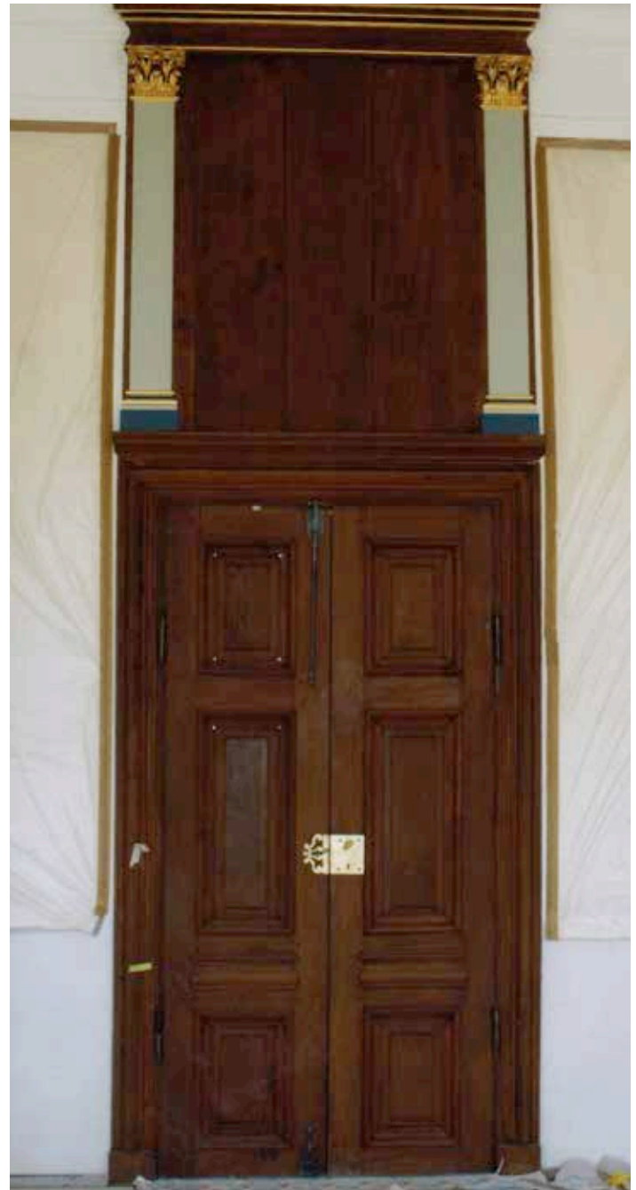
Detail Kapitelle während der Restaurierung (oben) und Tür und Wandvertäfelung Raum 210 vor und nach Abschluß der Arbeiten