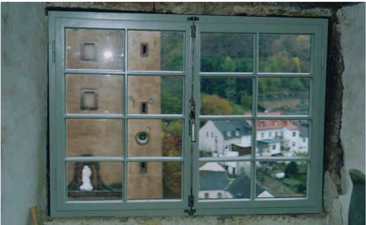
Mezzaninfenster nach Restaurierung und Wiedereinbau