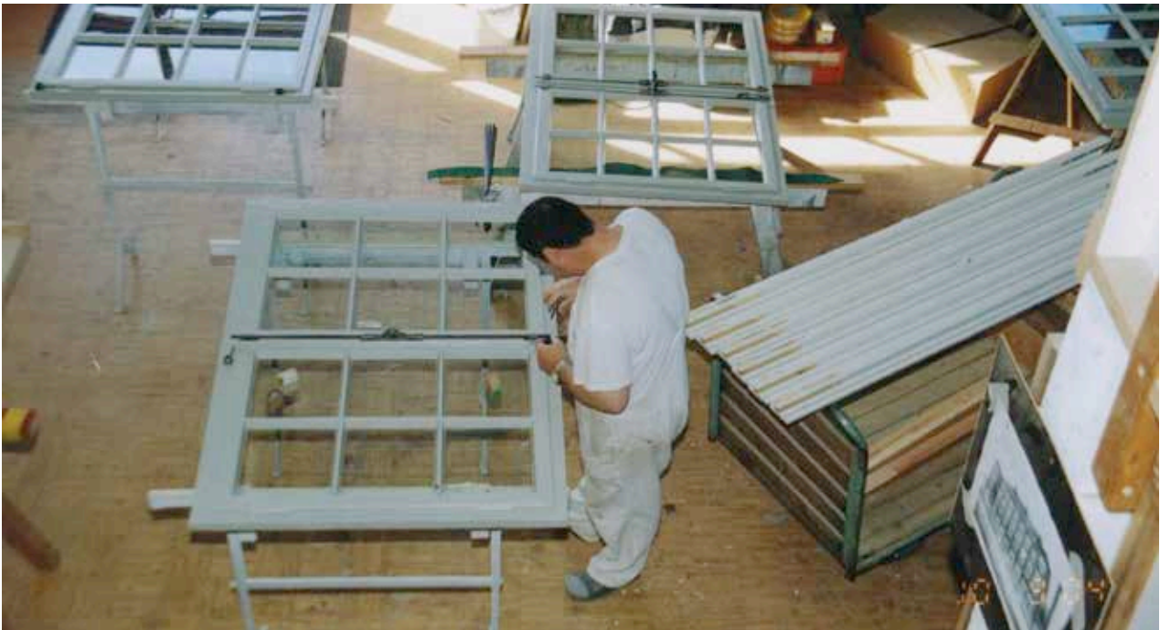
Aufbereitung Fenster Mezzaningeschoß Schloss Malberg in den Gutower Werkstätten