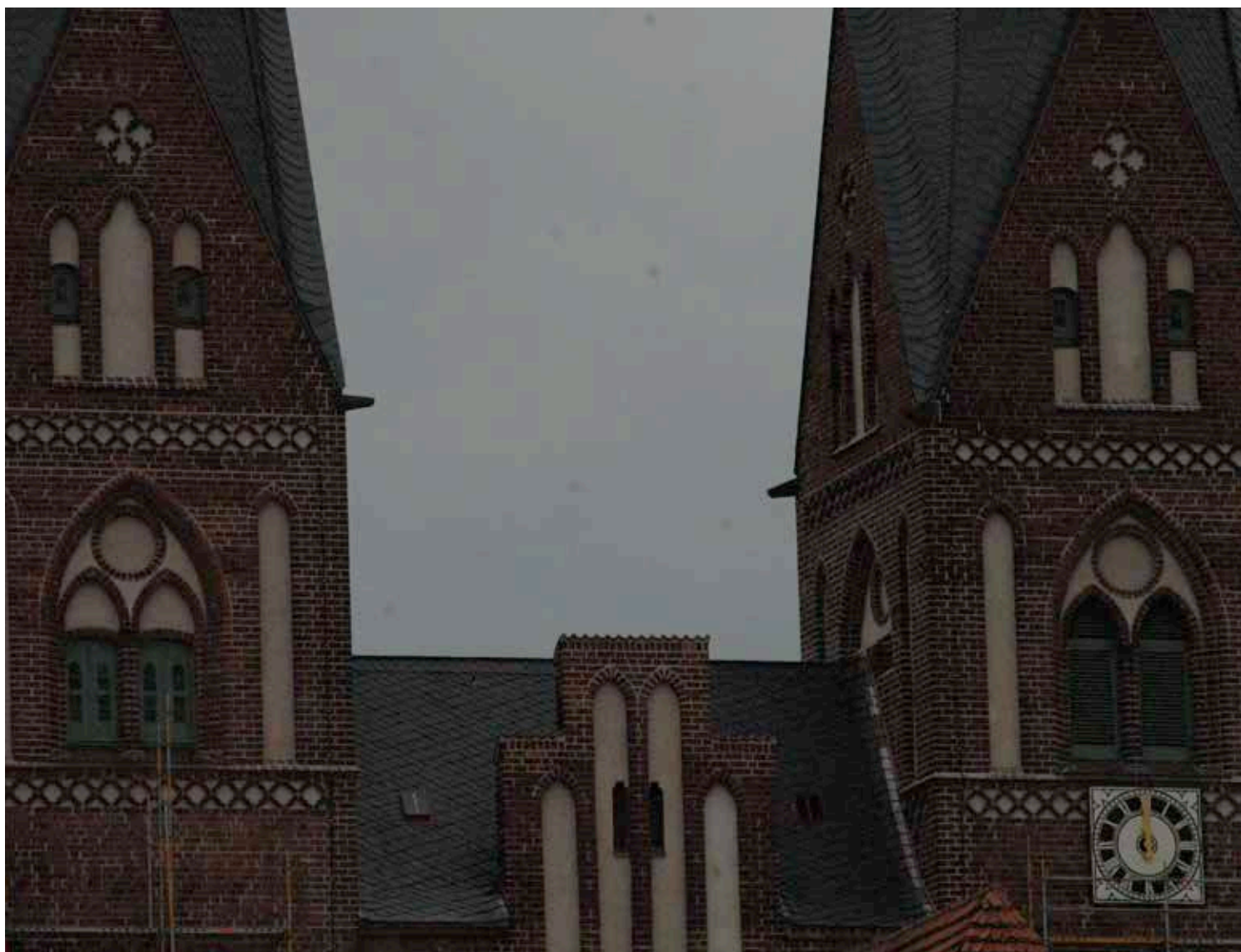
Ansicht Zwillingstürme nach Fertigstellung der Arbeiten