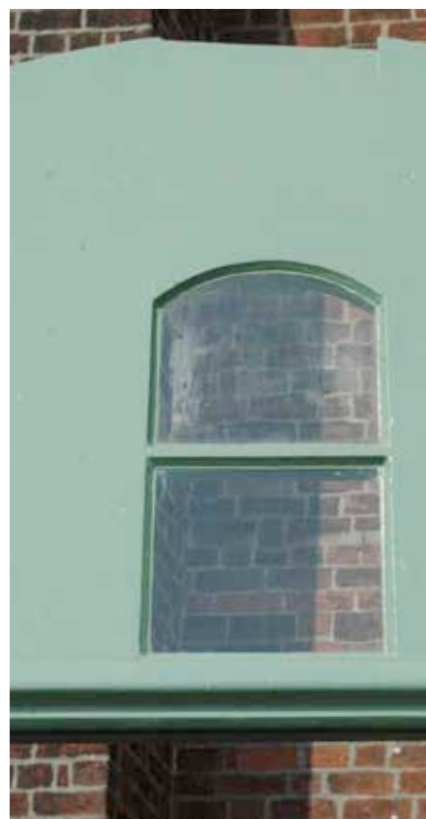
Zustand Detail Schallluken und Fenster im Turmbereich vor und nach der Restaurierung