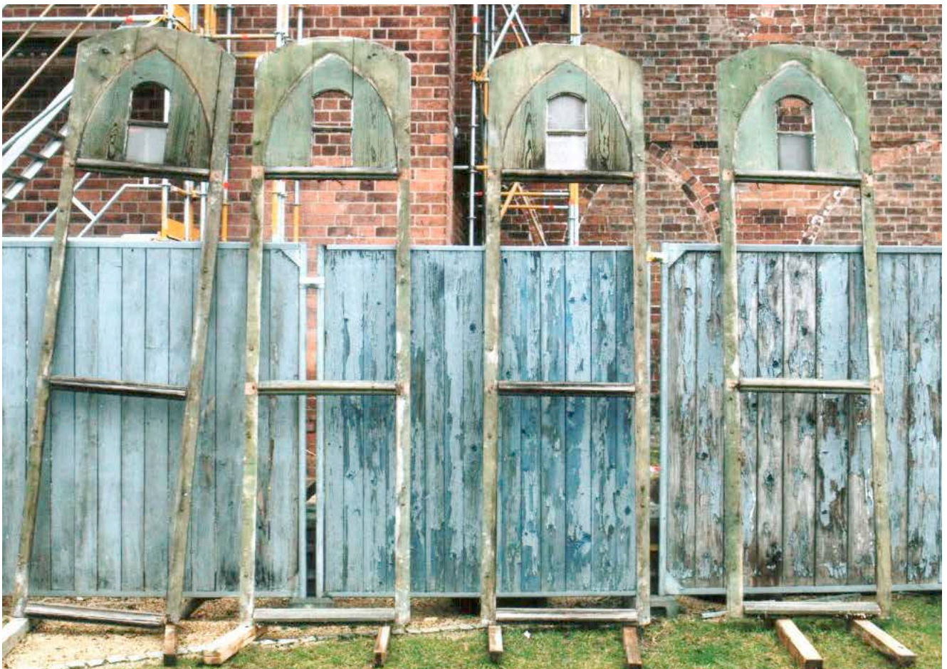
Schallluken nach dem Ausbau

Die Klosterkirche Neuruppin wurde um 1250 erbaut, die Türme 1906/07