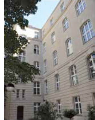
Fassade Ludwigkirchplatz Berlin

Objekt Büro- und Verwaltungsgebäude (Denkmal) Adresse Ludwigkirchplatz 3-4, 10719 Berlin Leistungen Fensterrunderneuerung und energetische Aufarbeitung historischer Fensteranlagen der Fassade im Innenhof - Fassade 2,3,4a,5a und Seitenfassade Ausführung 2013 - 2015