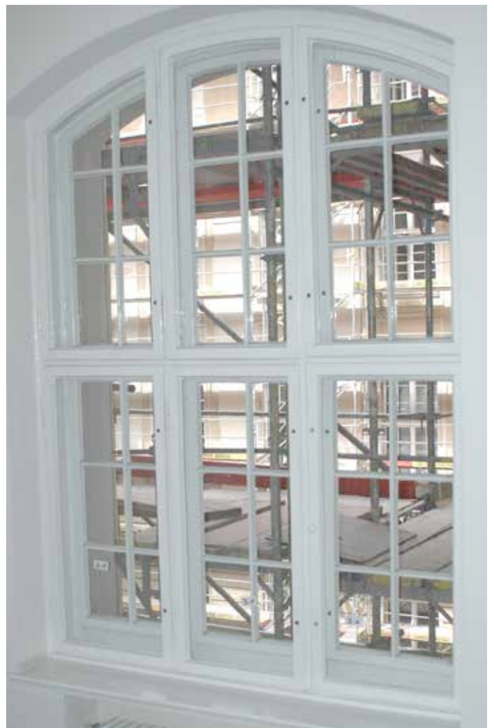
Zustand zur Fertigstellung