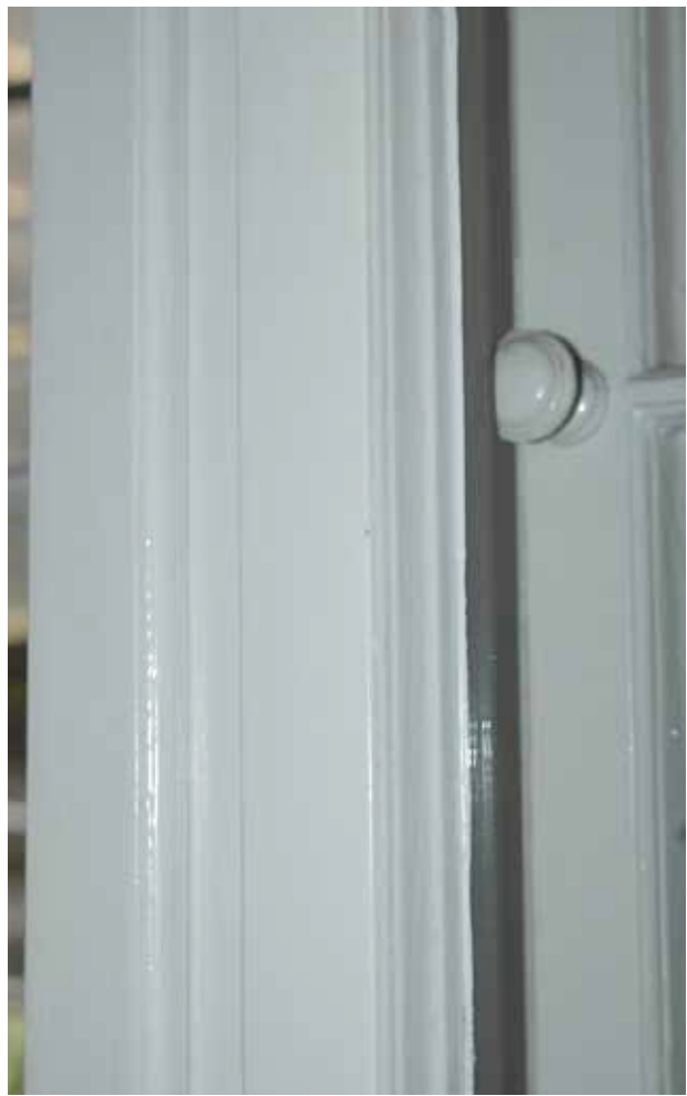
Vorzustand Fenster und Detail nach der Runderneuerung